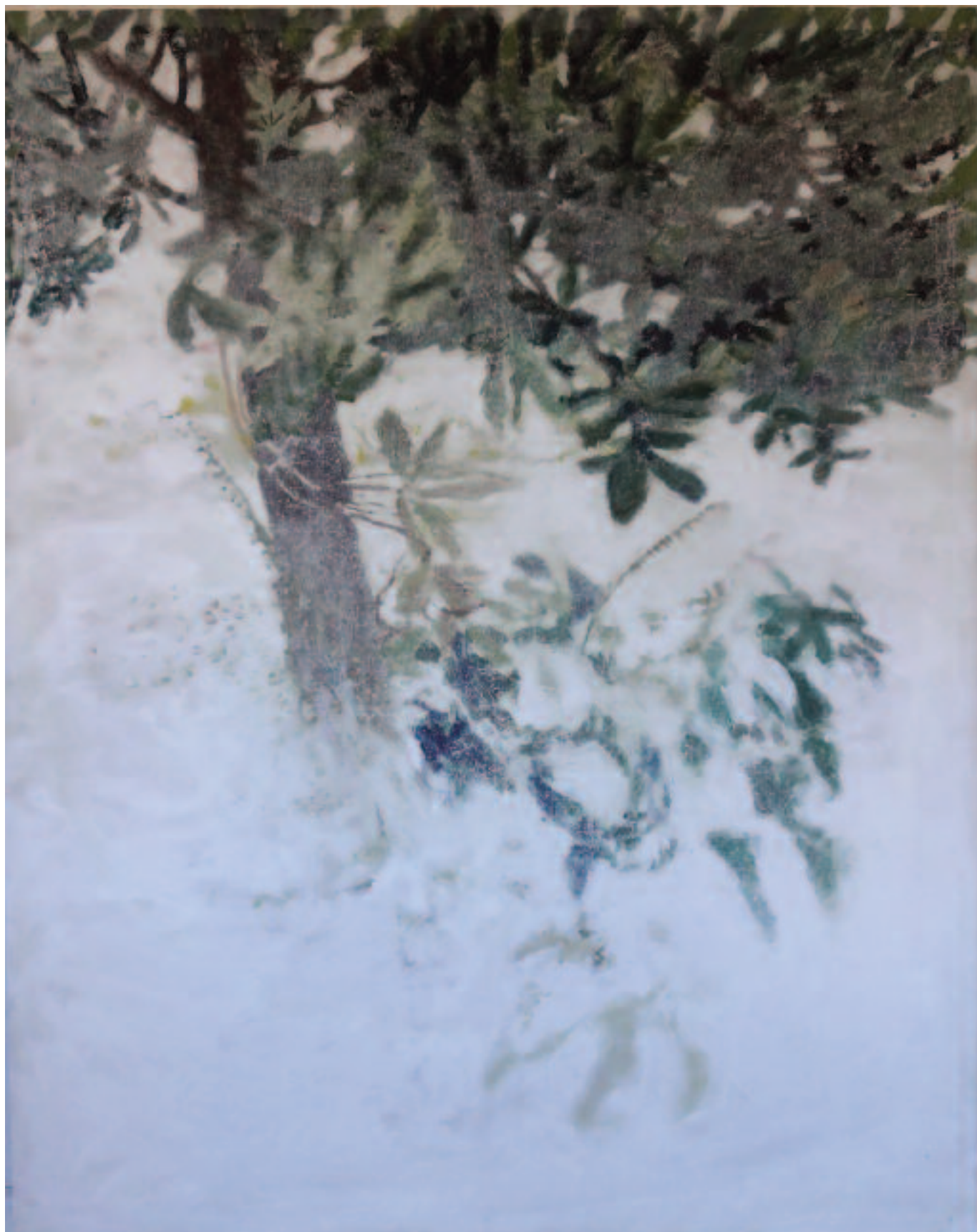
③ Reflets et lumières (2004-2010)

Brume , 2019 Pigments et liant sur toile, 195x150 cm