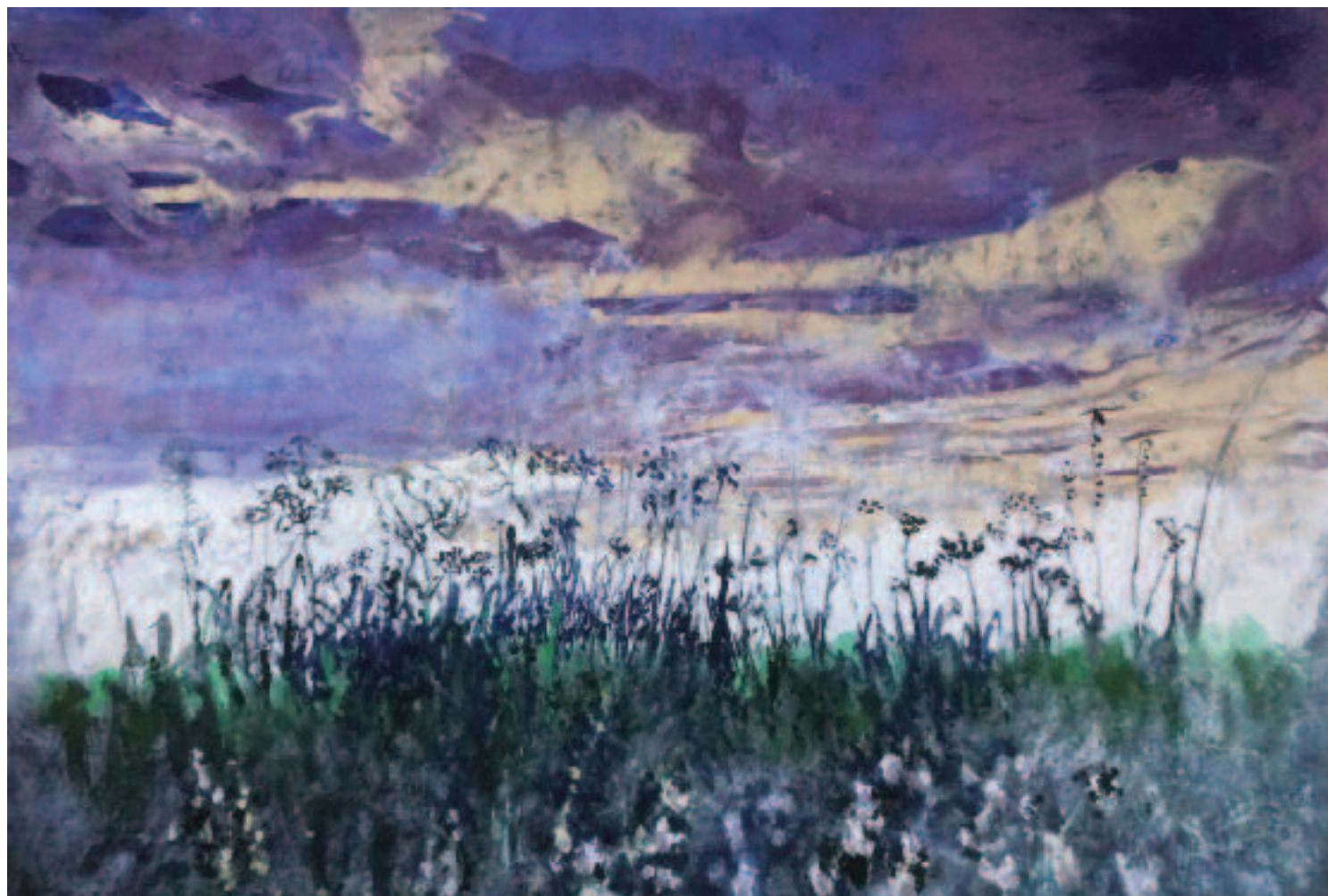
④ Champs et ciels (2012)

Champ , 2016 Pigments et liant sur toile, 90x140cm