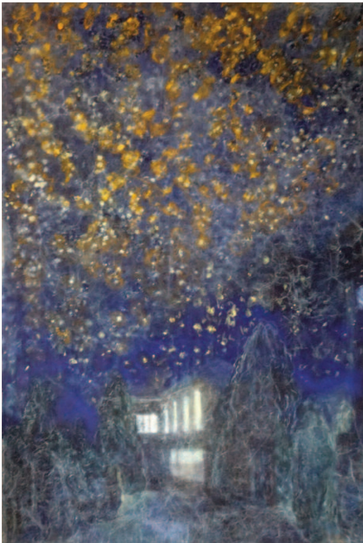
⑥ Nocturnes (2010-2019)

Nocturne , 2019 Pigments et liants sur toile, 195x130 cm