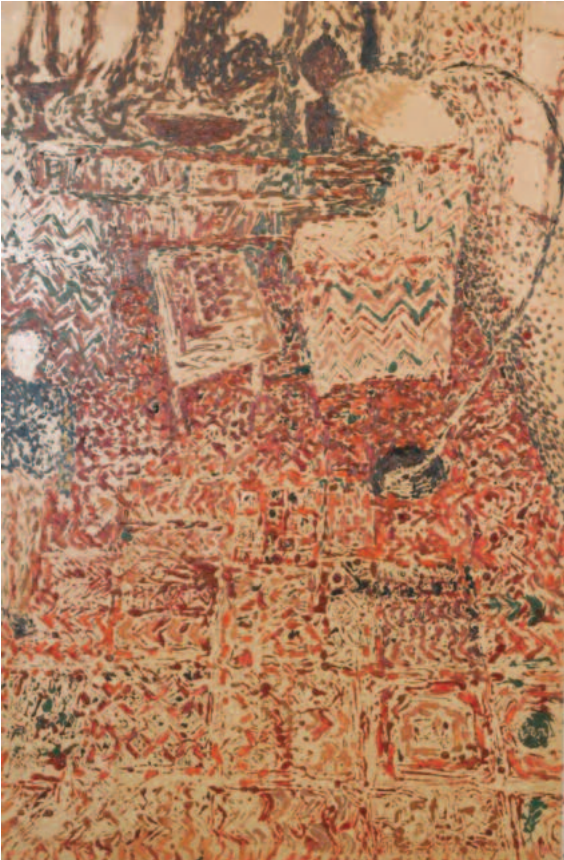
① Intérieurs (vers 1995)

Intérieur , 1992 Huile sur toile, 195x130 cm