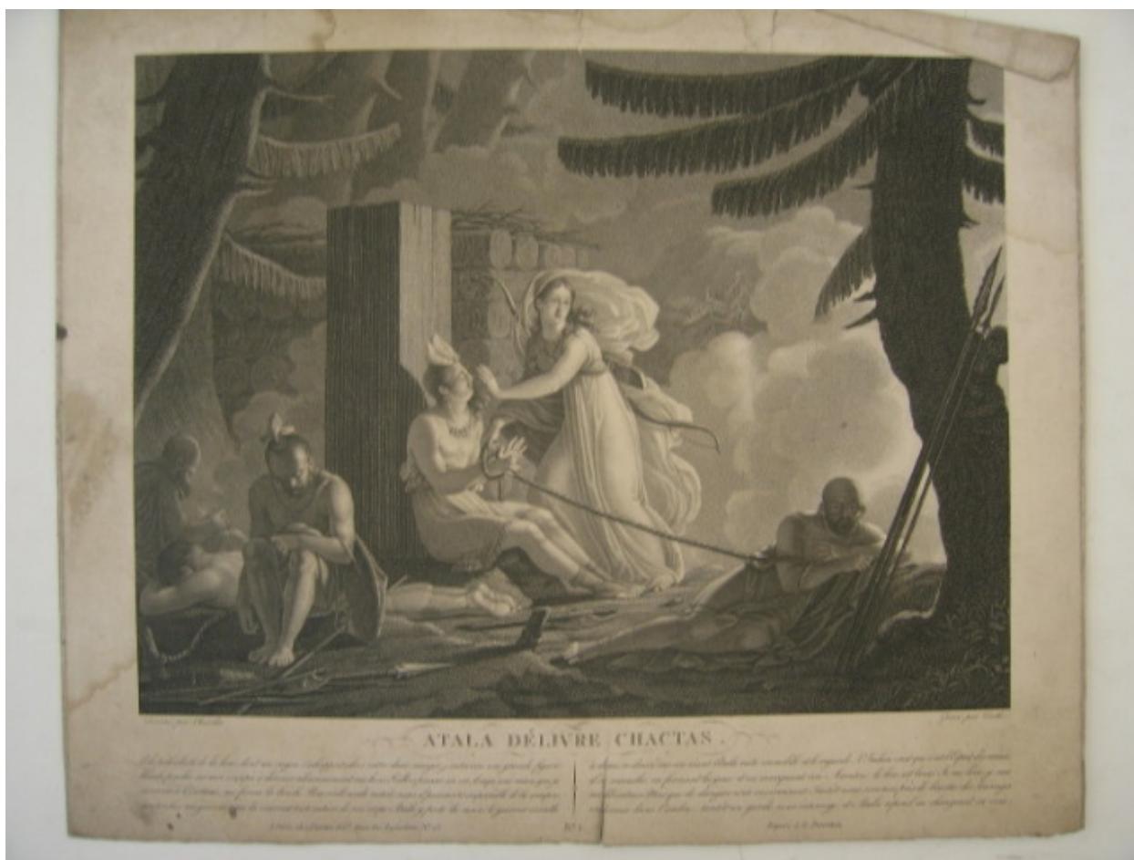
Gravure de Chasselat, « Atala délivre Chactas », 1817