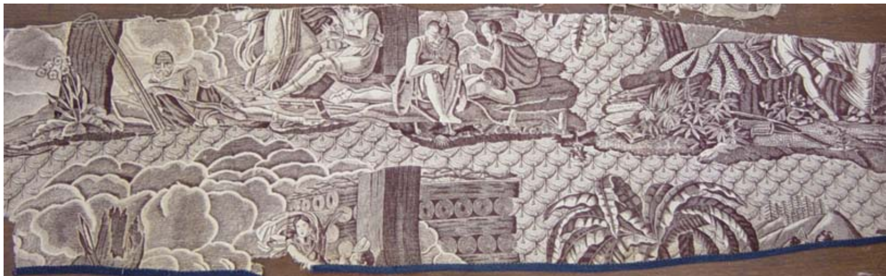
« Atala », toile imprimée en 1820 dans une manufacture normande, Musée de la toile de Jouy, Jouy-en-Josas, Inv. 983.33.5